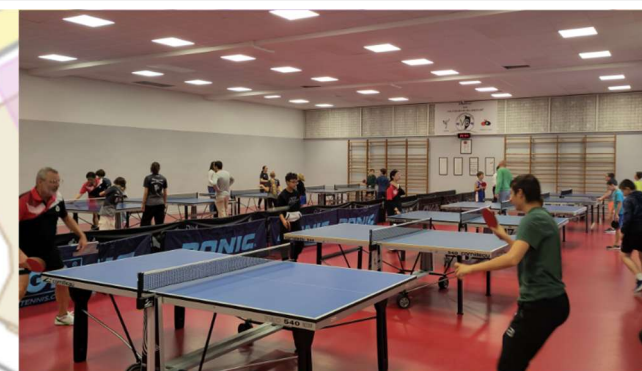
Salle des Voltigeurs