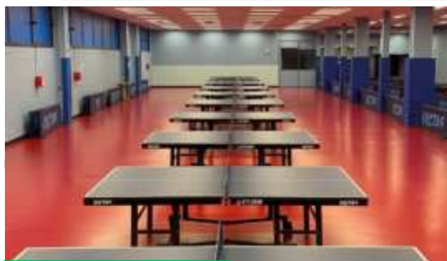
Salle Tennis-de-Table ACBB-TT