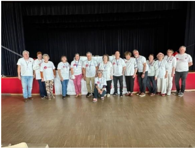
L'équipe du comité 17 presque au complet..