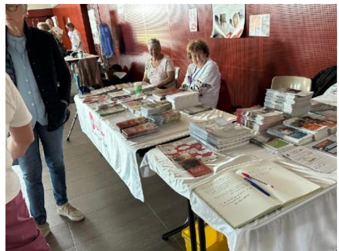
Le stand documentation